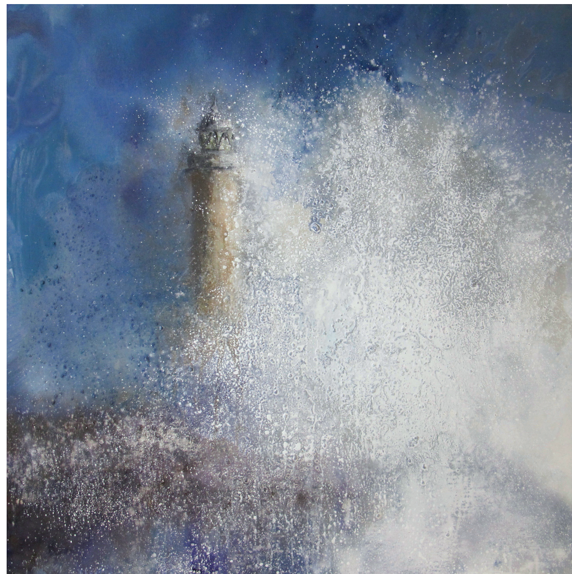
FAR DEL NORD Oli s/t. 100 x 100 cm