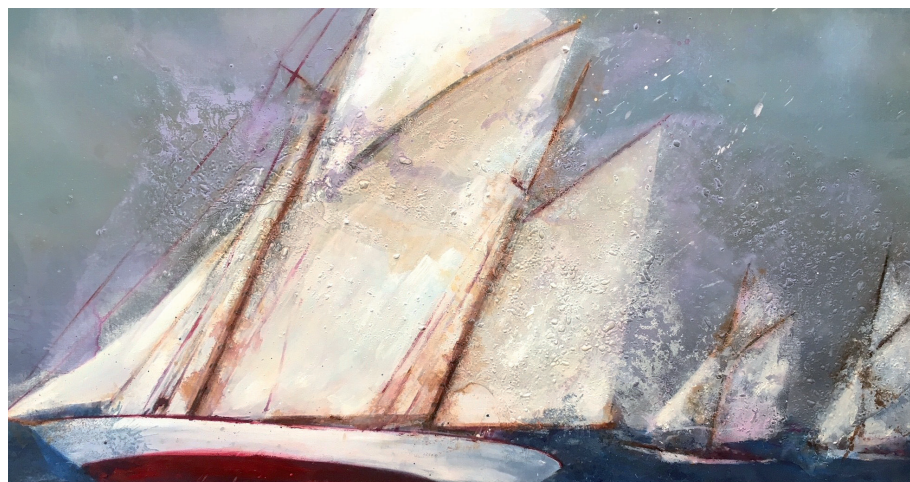
PRIMAVERA DE GARBÍ Oli s/t. 70 x 140 cm