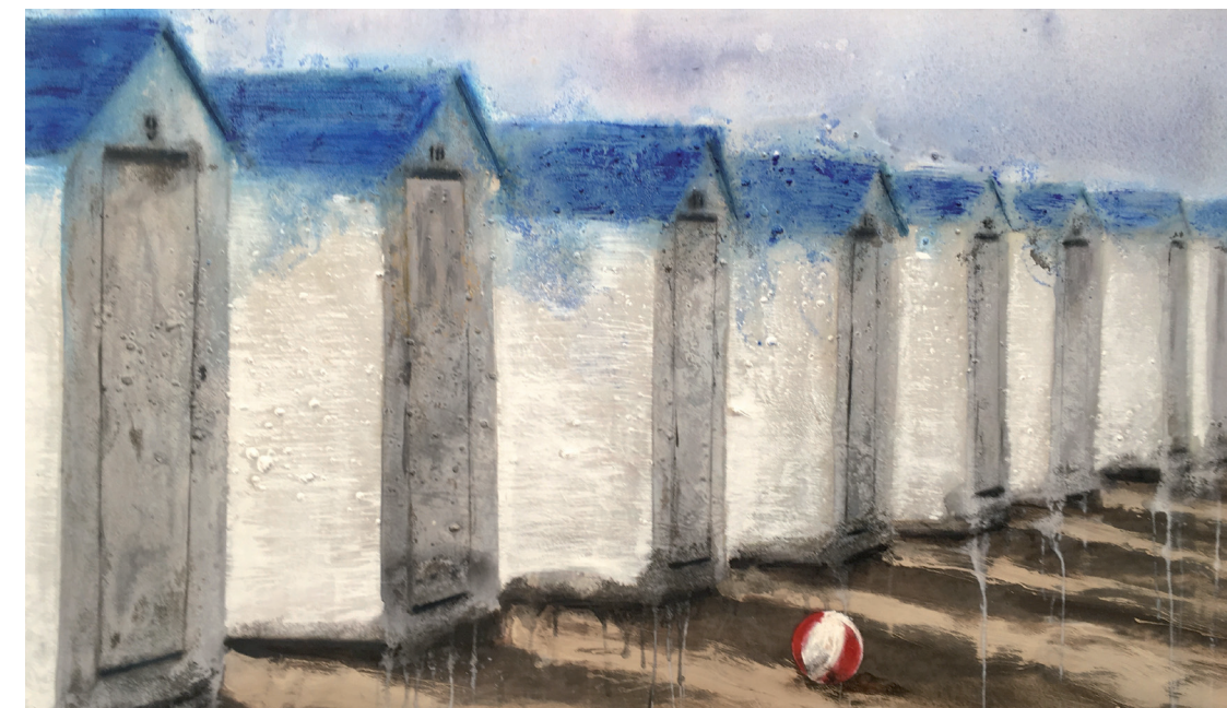
DIA TRANQUIL DE PLATJA Oli s/t. 80 x 140 cm