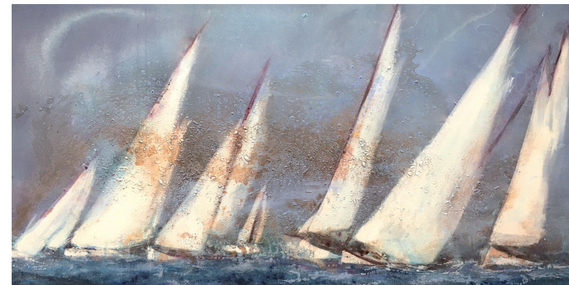
VELA CLÀSSICA Oli s/t. 70 x 140 cm