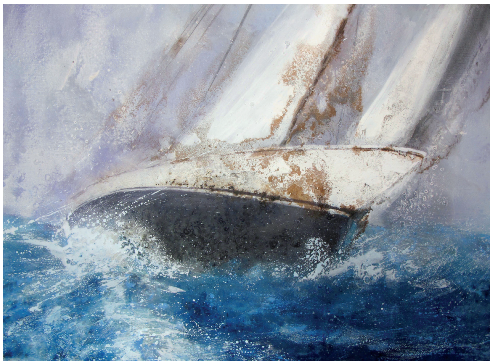
SOTAVENT. Oli s/t. 90 x 120 cm