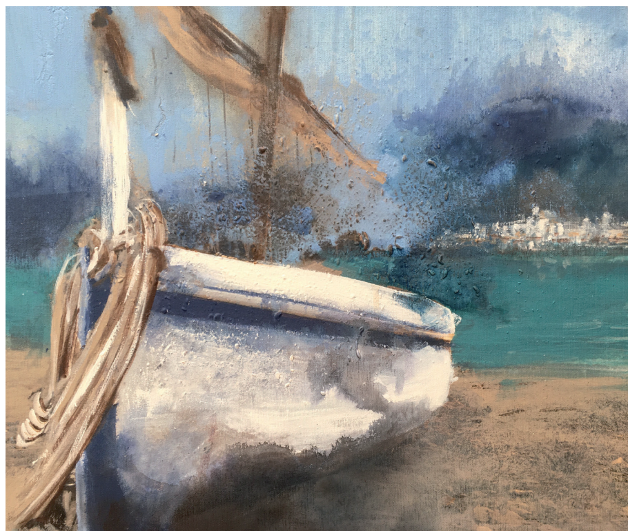
MATÍ A CADAQUÉS Oli s/t. 46 x 55 cm