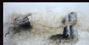
Portada: LLIGAMS DE L'ALT EMPORDÀ Oli s/t. 100 x 200 cm

P. JOSEP-ENRIC PARELLADA Monjo de Montserrat