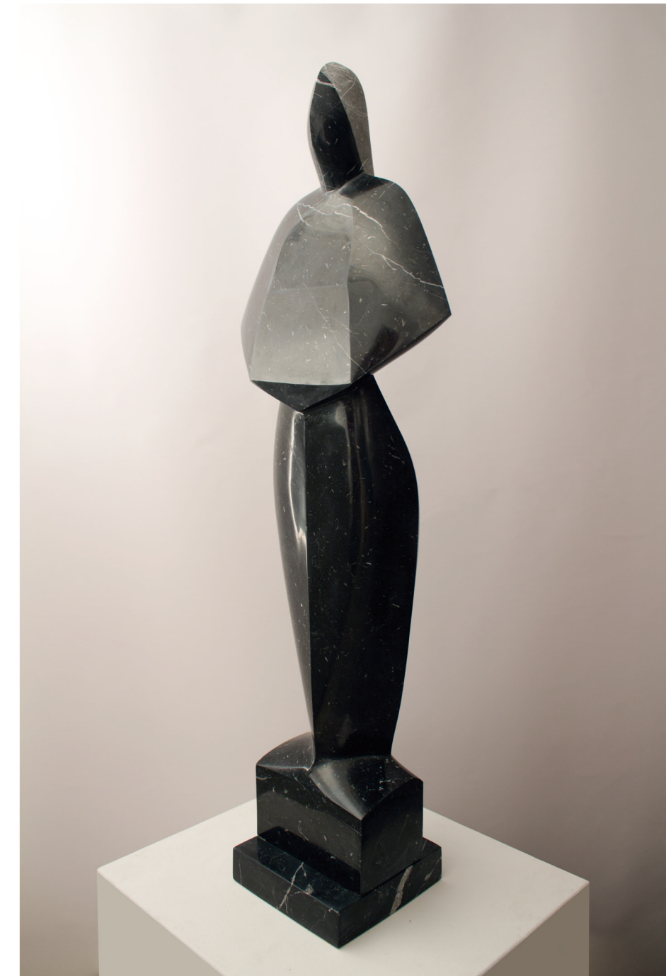
TEMPESTA Marbre negre de Markina 117 x 40 x 22 cm