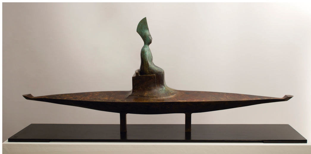
ÍTACA II. Bronze, 56 x 130 x 28 cm