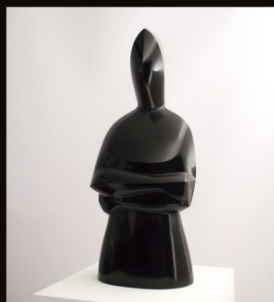
Portada: MIRALL DE LLUNA Marbre negre de Bèlgica 50 x 25 x 16 cm

"El seu bagatge artístic i les seues influències, unides a una magistral tècnica i sublim resolució compositiva, situen l'artista Antoni Miquel Morro en una posició, en l'àmbit artístic contemporani, difícilment superable i les seues obres representen, amb tota certesa, la plenitud de la forma en l'escultura." (Mar Beltrán Alandete, Universitat de València).