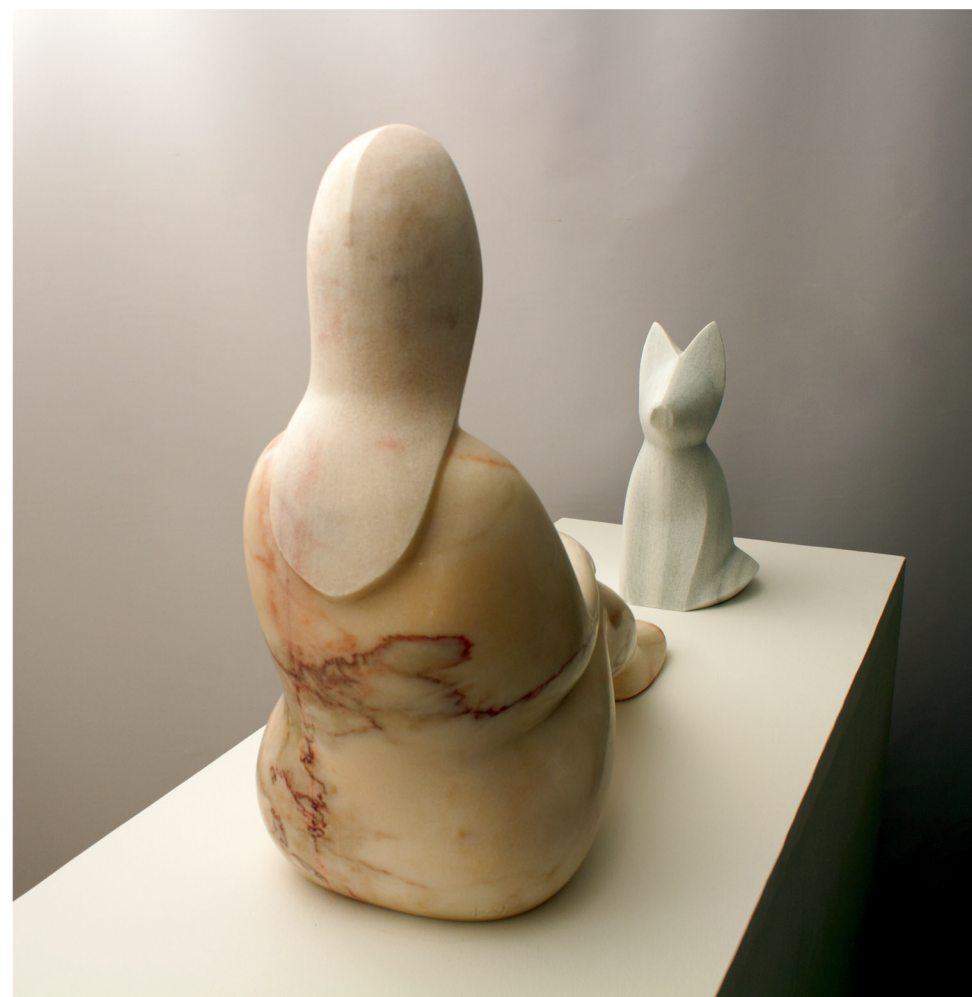
DUES REINES Marbres rosa de Portugal i blanc de Macael 51 x 90 x 30 cm