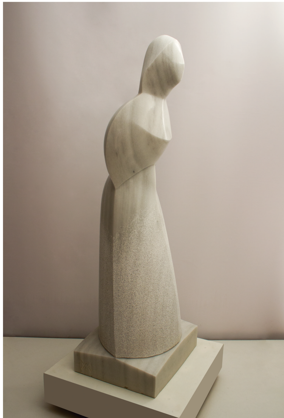
GYLANIA · HOMENATGE A MARIJA GIMBUTAS Marbre blanc de Macael 110 x 38 x 31 cm